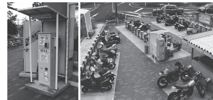
WAONカード対応精算機 イオングループ駐輪場